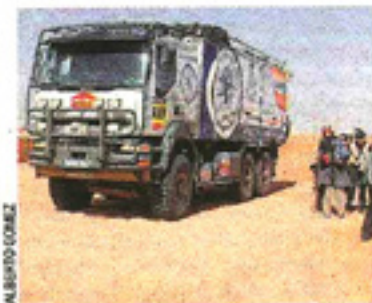
Imagen del Dakar solidario en 2007

El golpe a África por esta suspensión es grandísima, ya que el paso de la caravana del rally dejaba pingües beneficios económicos y evitaba numerosas muertes por esta necesaria ayuda. 2008 será un año horrible para estas zonas de África.